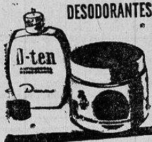
REGULA LA TRANSPIRACION DE LAS AXILAS Y LAS DESODORIZA POR VARIOS DIAS

Posee las siguientes condecoraciones: de la Junta Interamericana de Defensa; Medalla de Oro de reconocimiento al Mérito, de la Cruz Roja Cubana; Cruz y Placa General de División Ignacio Co-